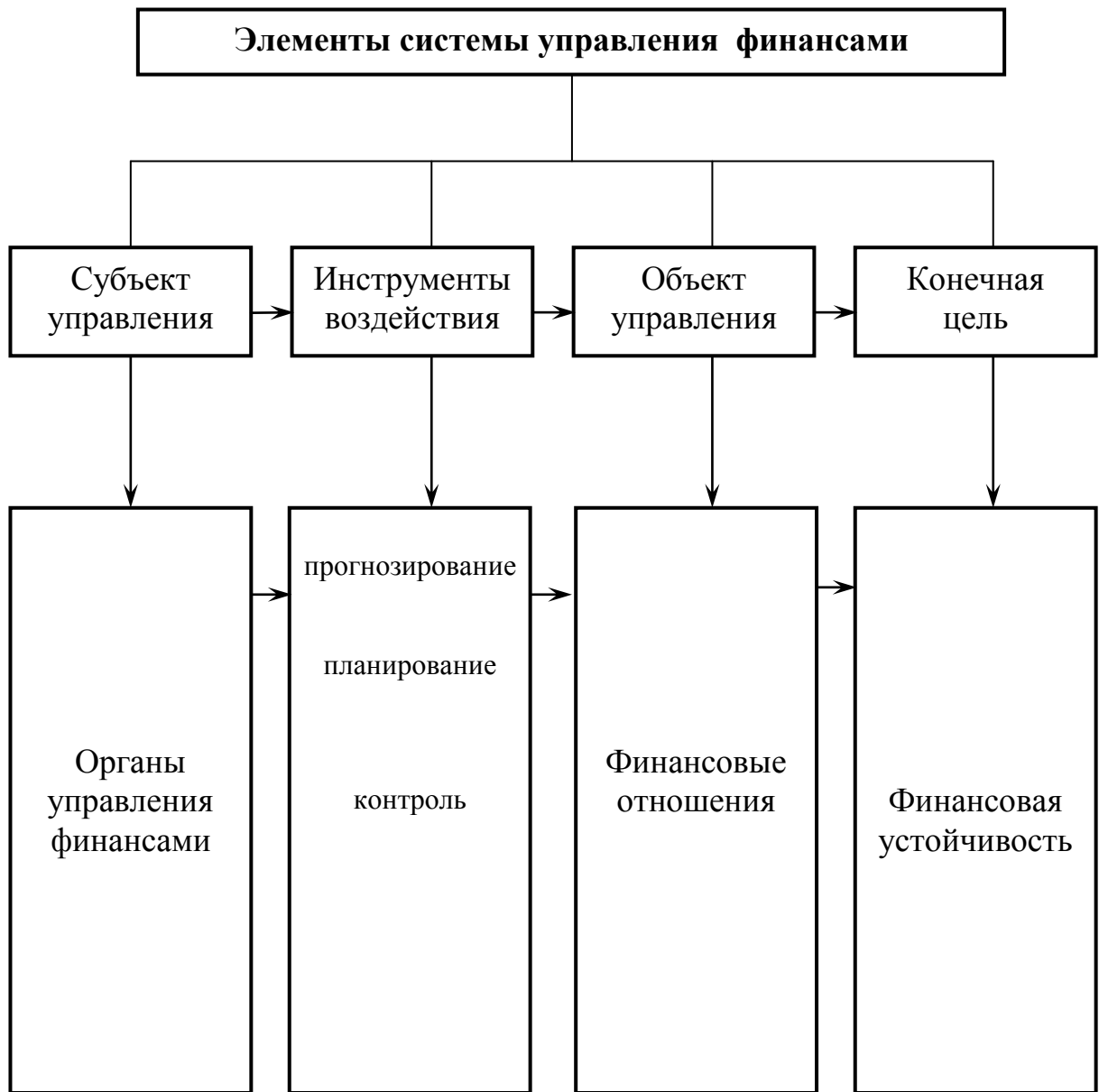
Схема 1. Система управления финансами